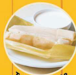
Tamal de Elote con natilla