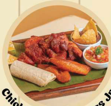
Chicharrones Delicias Jr.