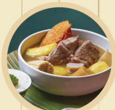
Olla de Carne