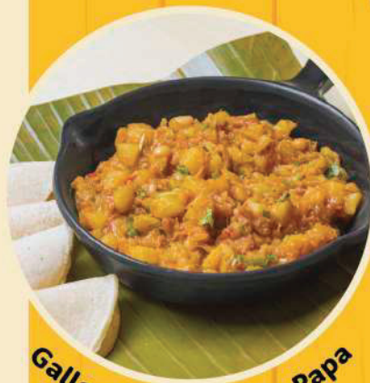
Gallo de Picadillo de Papa