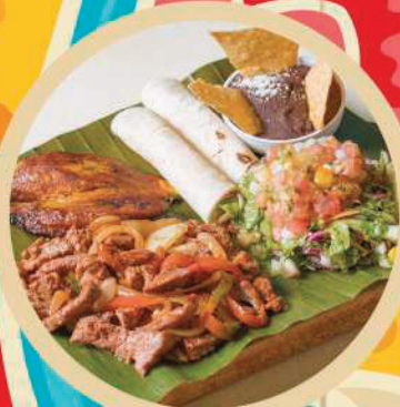
Fajitas de Res

Pechuga de pollo a la plancha, frijoles molidos, pico de gallo, plátano maduro y tortillas.