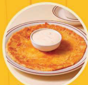
Tortilla Aliñada con natilla