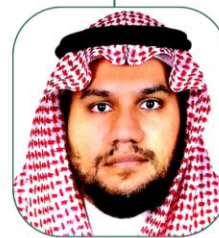
عبدالرحمن بن سعد بدري نائب الرئيس