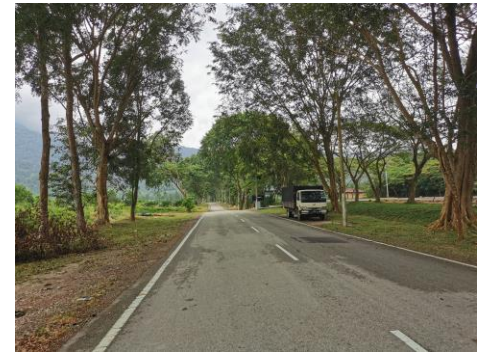
Gambar Semasa Tapak