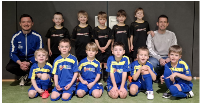
Hallenfußballturnier in Hachenburg