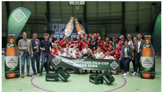
Der Sieger 2024: Malberg/Elkenroth/Rosenheim/Kausen