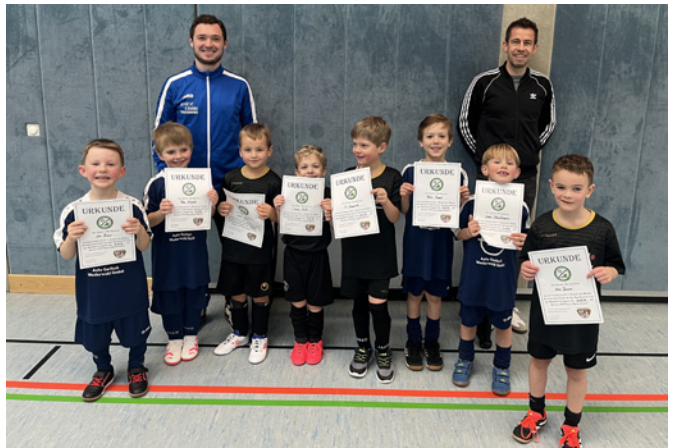
Stolze Kicker beim Turnier in Westerbürg

Trainer: Philipp Klöckner (Mobil: 0170 7712495)