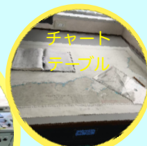
チャート テーブル