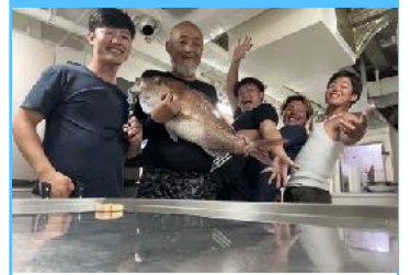
自由時間の過ごし方

みんなで外食に行ったり、買い物や観光に行ったりと陸に上がってリフレッシュをします。